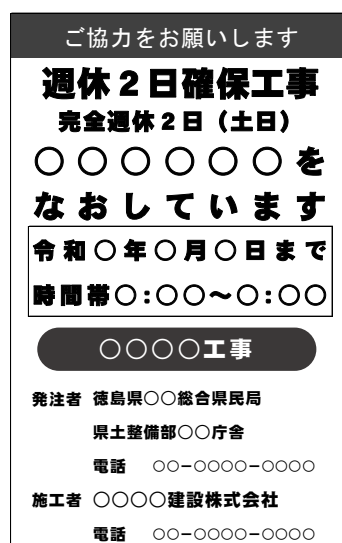
(標示板記載例) 完全週休2日(土日)の場合